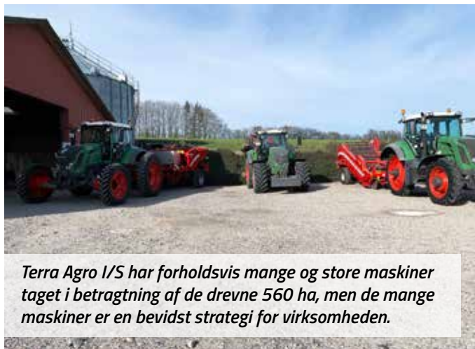
Terra Agro I/S har forholdsvis mange og store maskiner taget i betragtning af de drevne 560 ha, men de mange maskiner er en bevidst strategi for virksomheden.