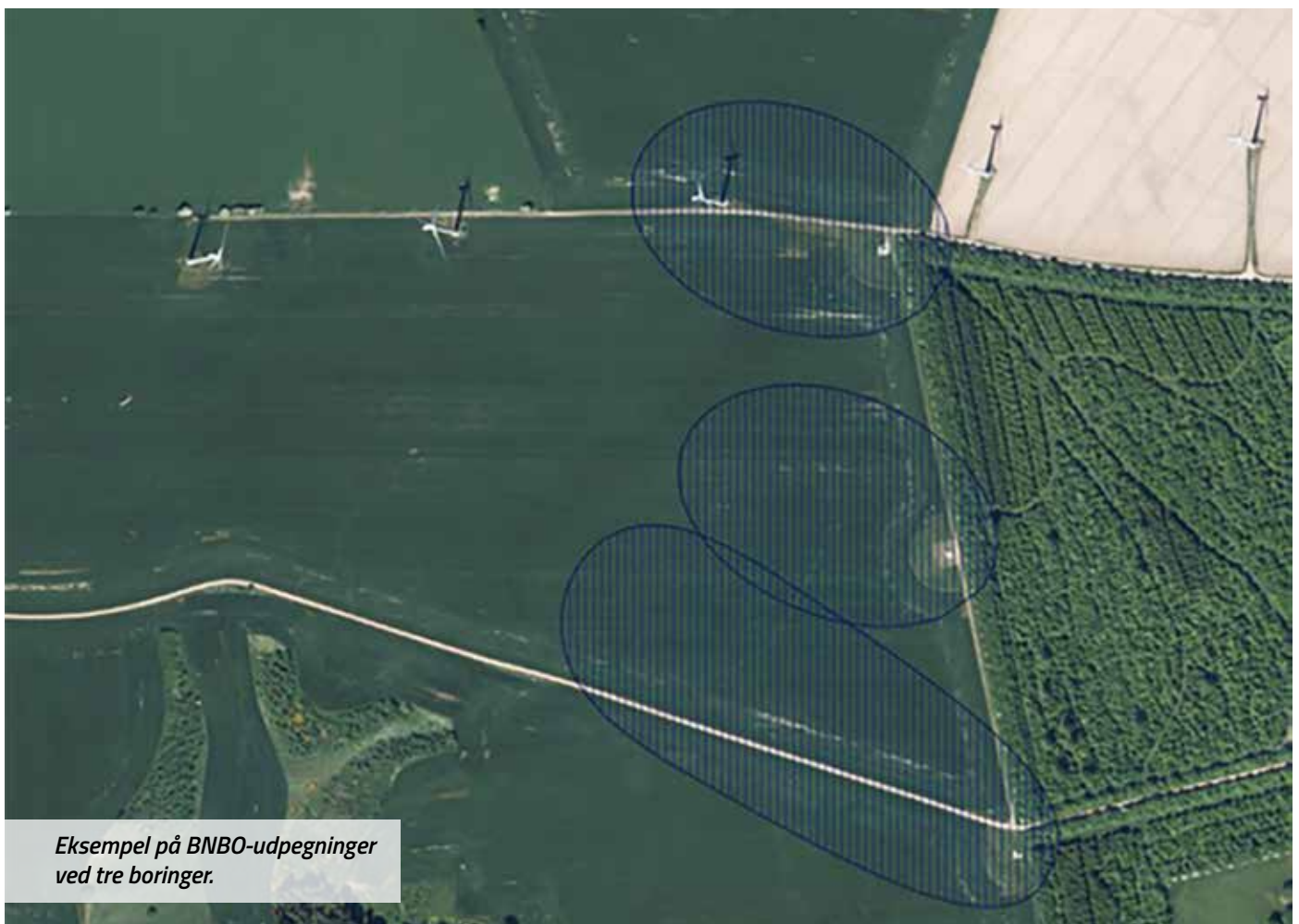
Eksempel på BNBO-udpegninger ved tre boringer.

Det vigtigste element er, at erstatningen for pålæg af pesticidfri drift skal beregnes på baggrund af nedgangen i den berørte ejendoms værdi.