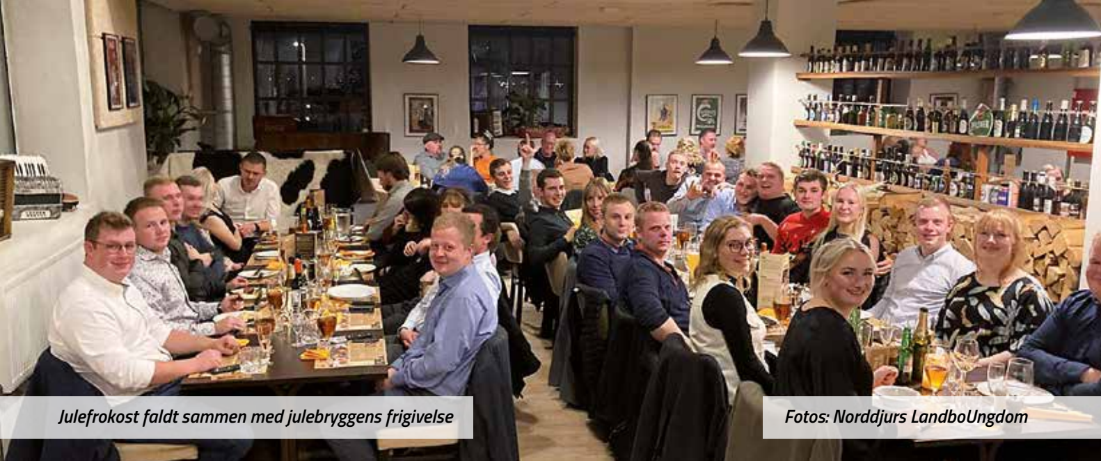
Julefrokost faldt sammen med julebryggens frigivelse