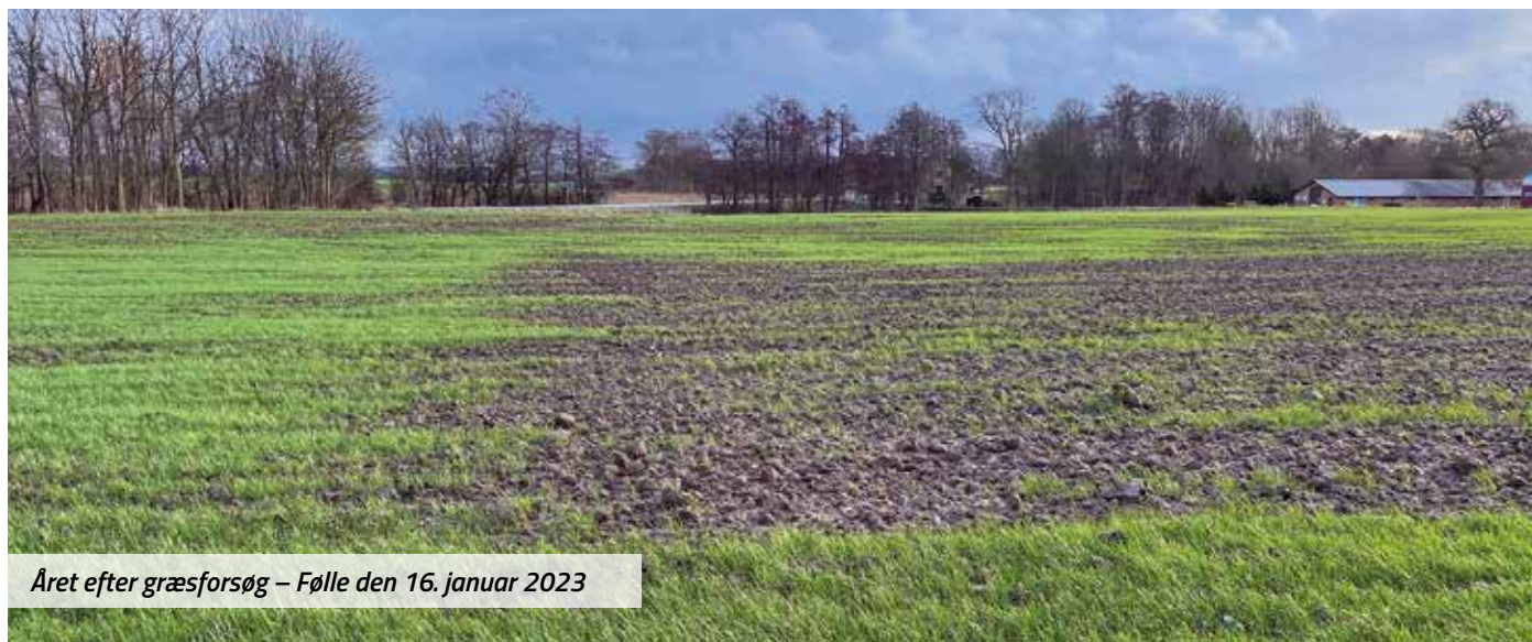
Året efter græsforsøg – Følle den 16. januar 2023

Det er noget vådt alle vegne. Hvor der ikke står decideret vand, er det "bare" meget vådt og blødt. De fleste vinterafgrøder klarer sig indtil nu meget flot, selv om de nærmest står i vand til halsen. Tilsyneladende betyder det milde vejr markant mere for væksten, end om der kommer 100 mm mere eller mindre.