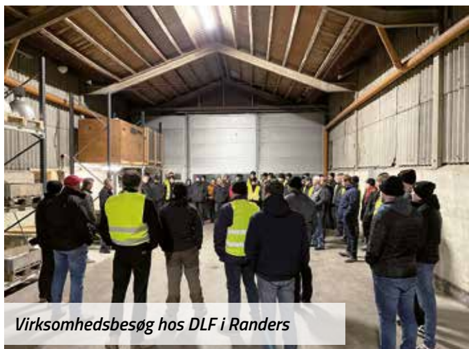
Virksomhedsbesøg hos DLF i Randers

Men det er først nu, det svære arbejde begynder. Vi skal fastholde det moment og den gode stime, Landboungdom er inde i. Dette gøres på landsplan bl.a. ved et weekendkursus i marts måned, hvor man kan lære alt fra ledelse af frivillige til personlig fremtoning, over til at lære at indstille sin plov korrekt.