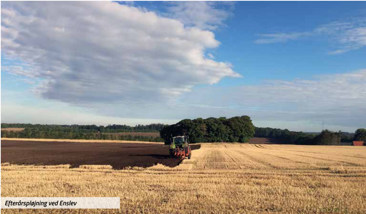
Efterårspløjning ved Enslev

Vi er nu alle kommet om på den anden side af høsten, som for langt de flestes vedkommende har været nem. Som jeg kan se det, har det været en relativ normal høst på Djursland, dog med rigtig store variationer i udbytterne.