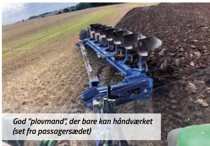
God "plovmand", der bare kan håndværket (set fra passagersædet)

almindelige) i hele foreningens vestlige område. Dette har selv i et år med en nem høst været noget af en nød at knække. Tidlig såning af vintersæd, mellemafgrøder, brak og nedsat N-kvote har været i anvendelse som alternativer mange steder. Vurder nu her, mens aug.-sept.-okt. står i frisk erindring, om det var den rigtige model, der blev valgt, eller der skal justeres til efteråret 2021. Vi har ikke kravene til 2021 endnu – men det skulle undre, om de slækkes – snarere tværtimod!