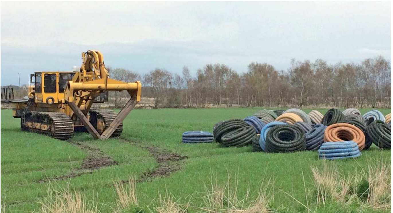
Den våde periode fra høst og frem til nu har vist, hvor stort behovet for en god dræning er.

Når man sammenholder den megen vand på jordoverfladen med de nye dræningsforsøg, hvor der i gennemsnit af seks år er tæt på 20 % merudbytte ved at have den korrekte drændybde (se figur), så kan det meget let konkluderes, at der i de næste år skal stor fokus på at få drænet jorden mange steder. Nogle steder skal der blot repareres, mens der andre steder skal nydrænes.