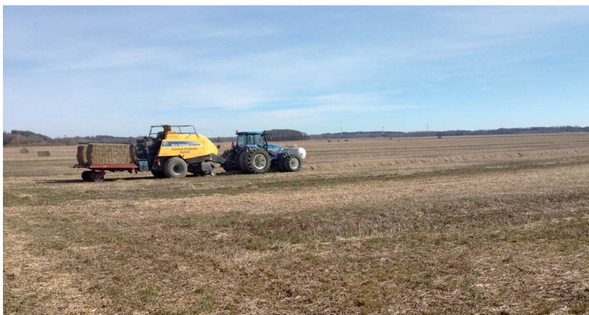
Presning af gammelt halm i Kolindsund.