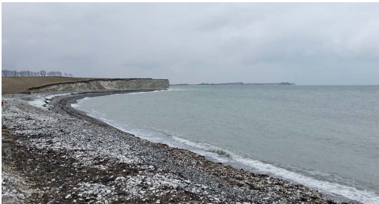
Karlby Klint ved Grenaa - marts 2018.