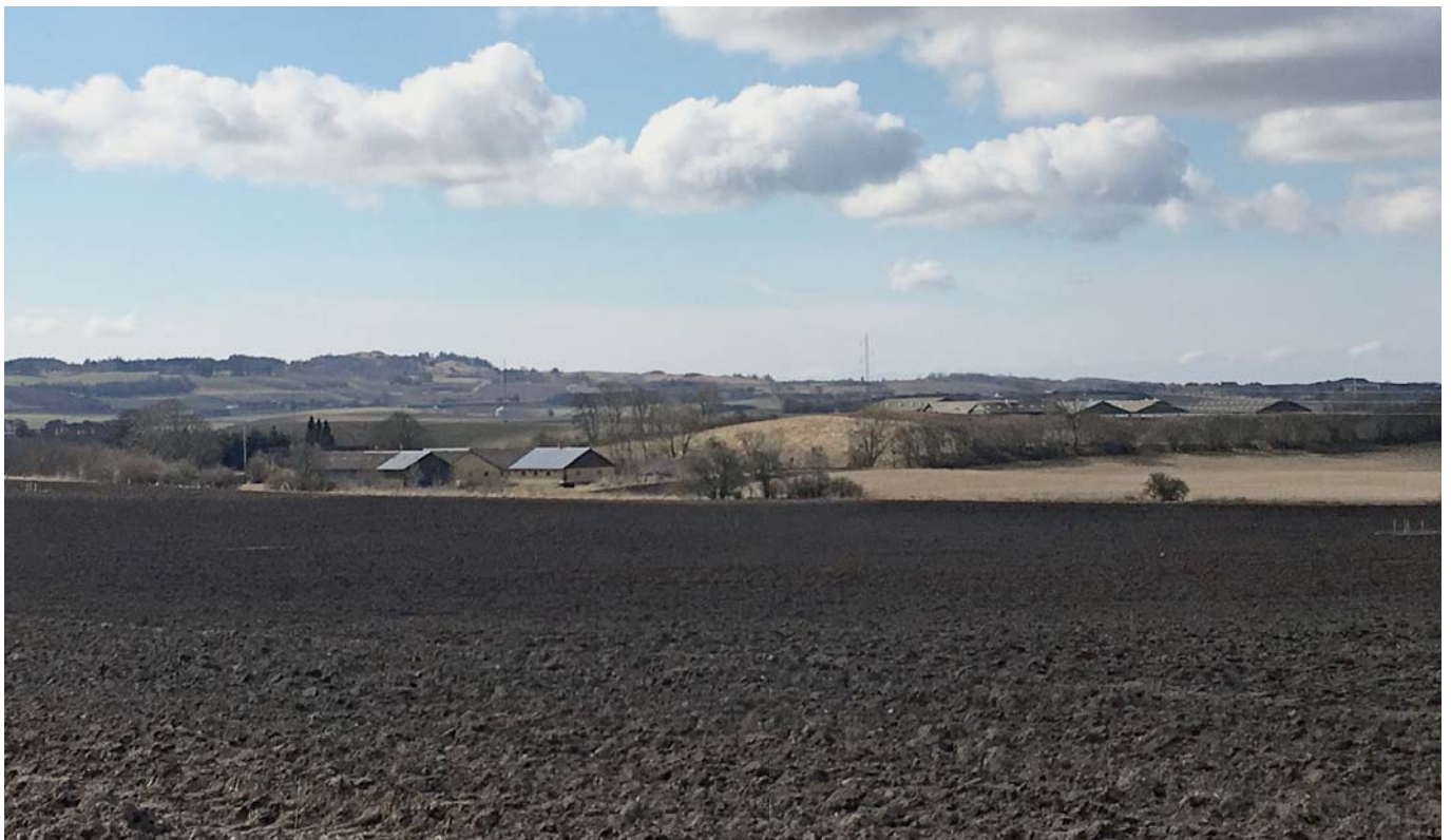
Pjøjemark ved Bjødstrup.

Jeg ønsker alle en god vækstsæson og et godt økonomisk år. ■