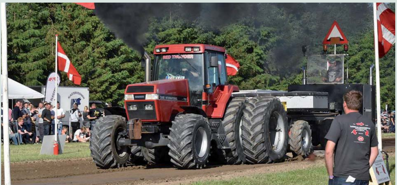
Traktortræk i Syddjurs.