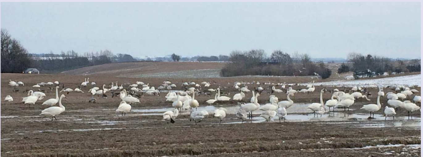
Svaner på uhøstet mark ved Assentoft.

For timelønnede elever og voksen elever (over 25 år) kan der være andre regler, så kontakt din lønassistent for at få mere at vide. ■