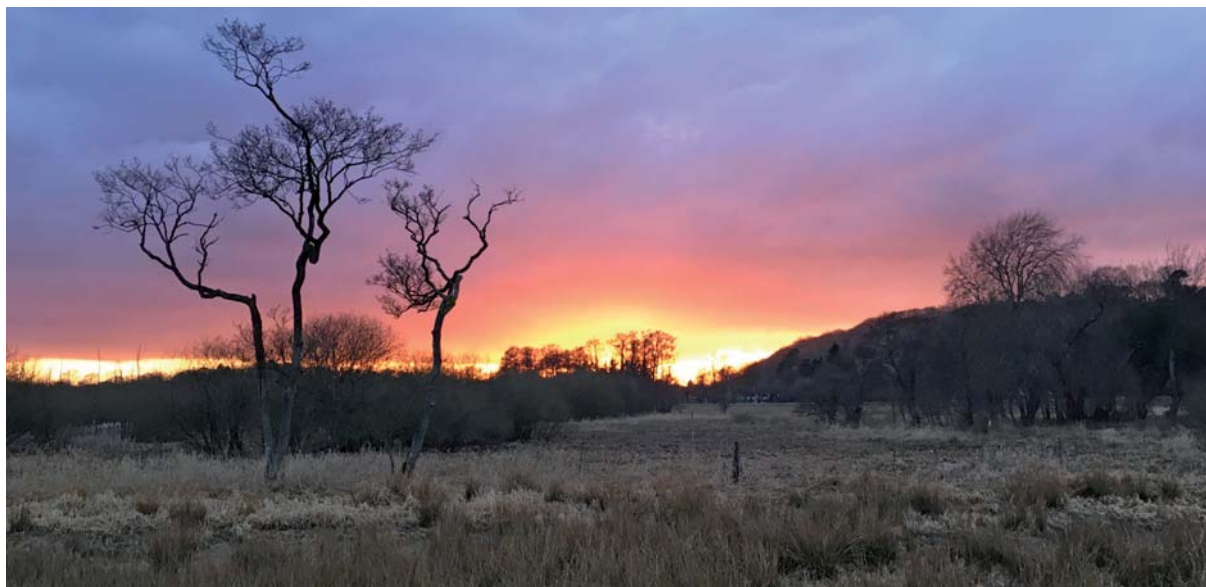
Solnedgang ved Sivested - marts 2018.