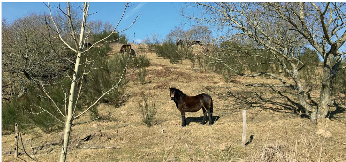
Heste i Mols Bjerge.

Kombinationssæreje er en ny "forbedret version" af skilsmissesæreje til gavn for arvingen og arvingens efterlevende ægtefælle, og man anvender derfor typisk ikke rene skilsmissesærejer i testamenter eller ægtepagter længere.