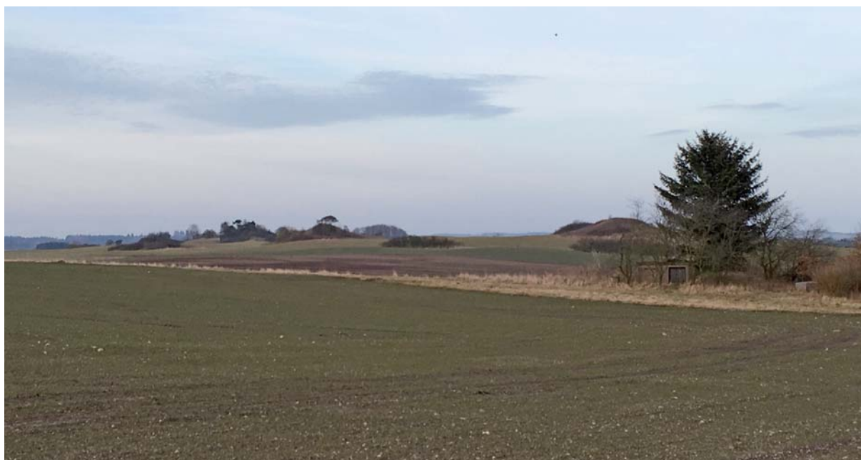
Sivested Mark med de mange gravhøje - april 2018.